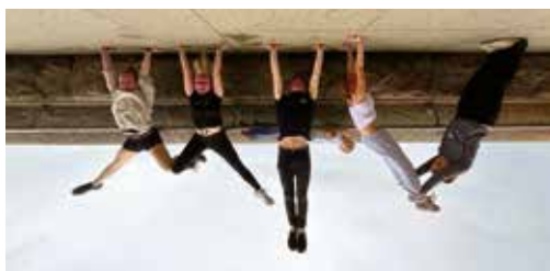
Turnerische Nachstellung unseres Vereinsnamens - MTV

Mit großer Vorfreude und einer ordentlichen Portion Abenteuerlust machte sich die Jugendgruppe des MTV 1860 Erfurt gemeinsam mit ihren Betreuern auf den Weg zum Turnfest Leipzig 2025 – dem größten Breitensportevent der Welt. Und was für ein Erlebnis es wurde!