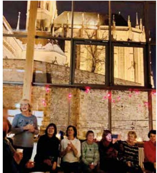
Weihnachtliches Beisammensein vor stimmungsvoller Erfurter Domkulisse

Trainerin mit Vorbildcharakter. Sie hat uns wöchentlich für den Freizeitsport begeistert und uns zusammengeschweisst oder besser gesagt „zusammengeschwitzt“.