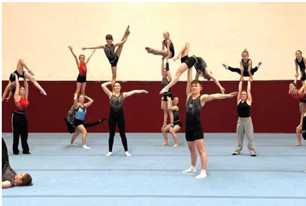
Das intensive Training, gepaart mit Ausdauer und Kampfgeist hat sich gelohnt