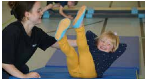
Bewegungsfreude bei den Kindern fördern, gehörte zu meinen Aufgaben im Verein

Auch persönlich habe ich mich weiterentwickelt und dazugelernt: Der tägliche Kontakt mit Kindern, das Lösen kleiner und großer Herausforderungen und die Verantwortung, die mir übertragen wird, haben mich selbstsicherer gemacht.