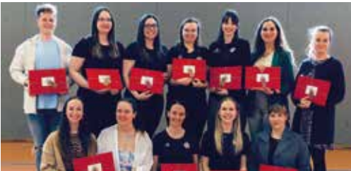
Kleine Aufmerksamkeiten erfreuen und erhalten die Tanzlust

Nach der Deutschen Meisterschaft ist die Turniersaison vorbei und das haben wir mit einer Saisonabschlussfeier mit der gesamten Abteilung des Karnevalistischen Tanzsports gebührend gefeiert. Alle Altersklassen samt Tänzerinnen und Tänzern, Trainerinnen und Trainern, Betreuerinnen und Eltern trafen sich kurz vor Ostern, um die Erfolge gemeinsam zu feiern und allen Beteiligten für ihren Einsatz zu danken.