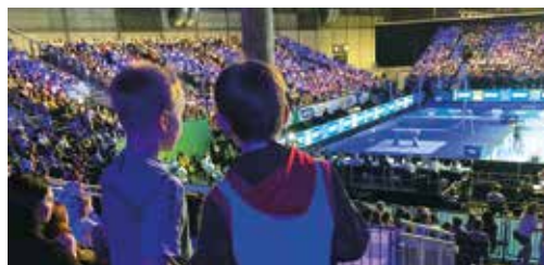
Die Atmosphäre aufnehmen und als Motivation ins eigene Training mitnehmen

genen Auftritt unserer Turnerinnen und Turner bei.