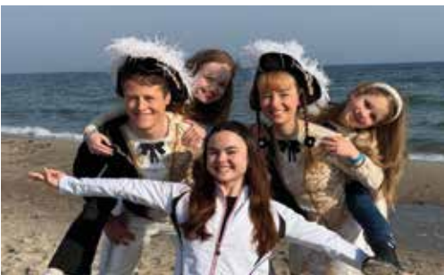
Tanzen vor der Traumkulisse - die Solisten und unser Tanzpaar hat es beflügelt