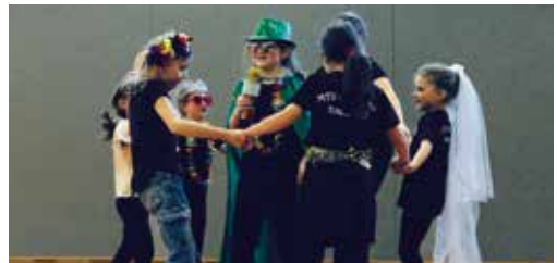
Wie viel Kreativität in einer halben Stunde liegt, stellten auch die Junioren unter Beweis

Nachdem alle satt und zufrieden waren und bereits gute Gespräche geführt hatten, kam noch einmal Action ins Geschehen. In selbst gewählten Gruppen durften alle zu selbstgewählten Songs innerhalb einer halben Stunde eine kleine MTV-Mini-Playback-Show einstudieren. Wir hatten zuvor nur angekündigt, bunte und lustige Accessoires mitzubringen – was sie damit anfangen sollten, erfuhren die Tänzerinnen und Tänzer aber erst vor Ort. Trainer und Eltern zeigten sich beeindruckt von der Kreativität der Tänzerinnen und Tänzer, denn sie ließen sich in der halben Stunde Vorbereitungszeit wahnsinnig viel einfallen und unterhielten uns alle prächtig. Vom „Wackelkontakt“ über „Atemlos“ bis hin zum „Space Taxi“ war alles dabei, das die Entertainment-Qualitäten unserer Gruppen in den Vordergrund stellte. Alle Großen und Kleinen waren mit Feuereifer und viel Leidenschaft dabei.