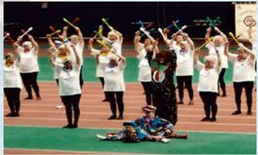
Aufführungen, wie hier zum 10. Seniorensporttag 2005, gehörten zum Programm der Gruppe