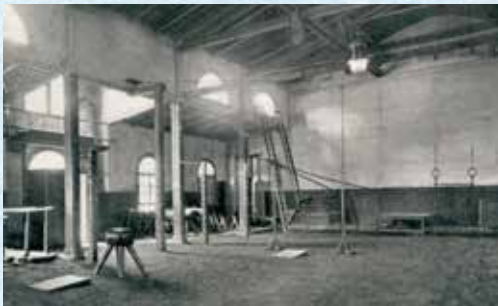
Die Turnhallen sahen damals noch anders aus, mancher Trainingsstart glich einem Abenteuer

Eigentlich fängt es an mit der Turnhalle. Heute gibt es laut Sportamt sehr viele marode Turnhallen. Das ist sicher der Fall, aber wir mussten in den 70er Jahren, um in die Turnhalle im Klostergelände hinter der Goetheschule (heute Edith-Stein-Schule) zu gelangen, erst einmal über einen langen Gang hinter der Schule, der im Winter zudem noch dunkel war, durch vier Türen, die alle unterschiedliche Schlüssel hatten.