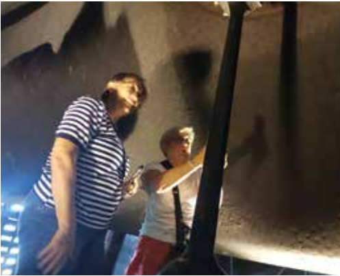
Einmal unter der Gloriosa stehen und den Klöppel schwingen - Traum und Faszination

Ganz weit oben auf dem Glockenturm des Erfurter Doms und dann unter der Gloriosa stehen, das war im Juli eine ganz besondere Gymnastikstunde. Wir 14 Frauen unserer Trainingsgruppe haben so unsere Muskeln einmal auf ganz anderer Art und Weise in Aktion gebracht.