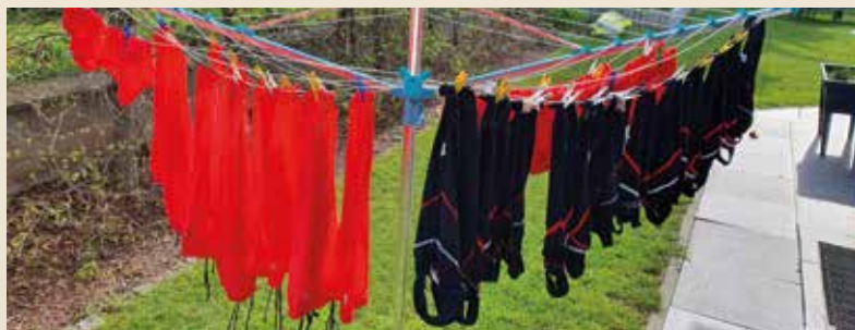
Nachbereitung eines Wettkampfes