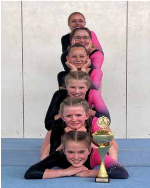
Die Überraschung und der Stolz stehen der 2. Mannschaft ins Gesicht geschrieben

Die Gerätturn-Landesliga erreichte kurz vor den Sommerferien mit den Finalwettkämpfen ihren Saisonhöhepunkt. Zunächst ging es am Samstag, den 10.06.2023 in Jena um den Sieg in den drei Staffeln der weiblichen Liga. Hier konnten die Frauen des MTV 1860 Erfurt in der 2. Liga ihre Spitzenposition behaupten und erreichten den Staffelsieg.