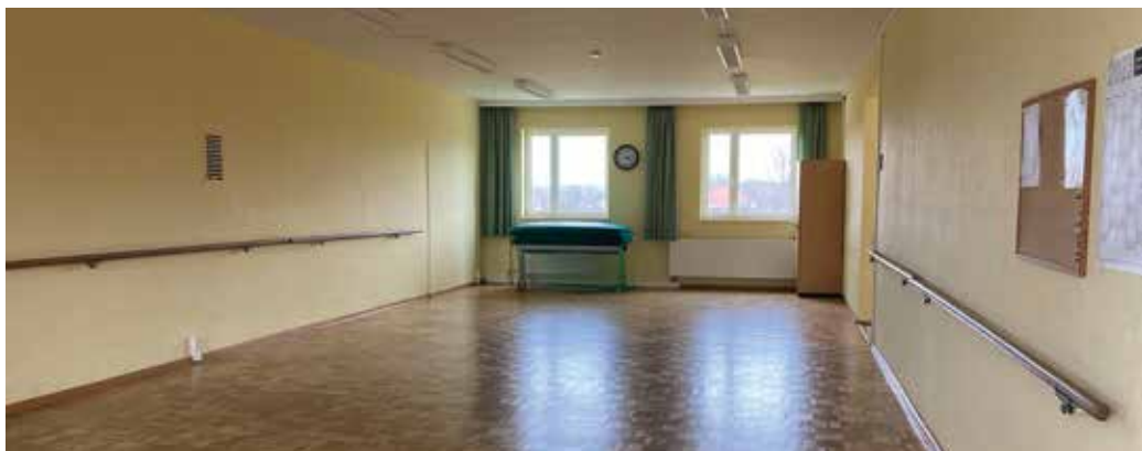
Eine fragwürdige Entscheidung: der liebevoll gestaltete und gepflegte Trainingsraum im Johannesplatzforum soll neuen Umkleiden zum Opfer fallen

Das Konzept der Stadt sieht vor, dass wir uns gemeinsam mit den Bogenschützen im gleichen Objekt einen Raum teilen. Ein Konzept, welches nicht mit den Nut-