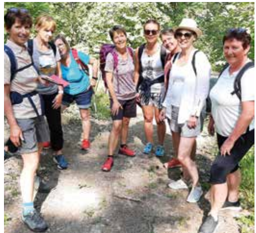
Furchtlose Frauen auf erkenntnisreicher Wandertour, bei bestem Wetter