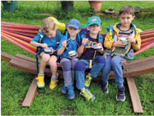
Eis essen in der hart verdienten Wanderpause

Schon am ersten Abend mussten alle ihr sportliches Geschick bei Teamspielen unter Beweis stellen.