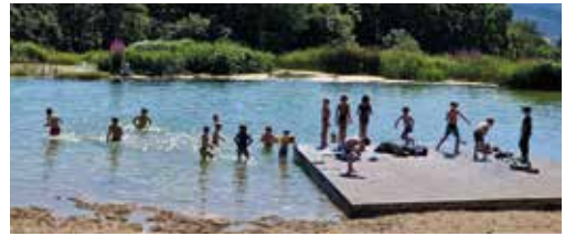
Der Sprung in den See darf nicht fehlen

und an der Kletterwand sowie zahlreiche Tischtennis- und Basketballmatches ließen die Zeit wie im Flug vergehen. Nicht fehlen durften natürlich die traditionelle Nachtwanderung mit Extra-Gruselfaktor und die beliebte Spieledisco.