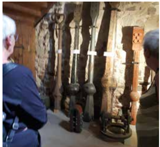
Sammlung historischer Klöppel

Der Abstieg der Treppen von der ruhmreichen „Königin der Glocken“, mit dem tiefen E im Klang und dem Lächeln der Maria war ein sehr entspannter. Die Einkehr zum Zusammensein bei Speis' und Trank in einem italienischen Restaurant hat allen sehr gefallen und war ein schöner Abschluss dieses ereignisreichen Tages.