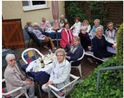
Emotionaler Abschied von der Übungsgruppe

stunden viel zu schnell. Leider war es an diesem Tag sehr kühl und windig, sonst wären alle noch länger geblieben. Doch zuvor gab es noch eine kabarettistische Einlage und lustige Vorträge.