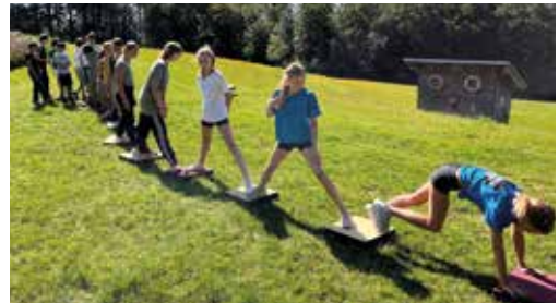
Geschicklichkeit und Einfallsreichtum waren beim Fliesenhopping gefragt

Das schöne Wetter ermöglichte das ausgiebige Baden im See. Am letzten Abend wurde dann ein großes Lagerfeuer entzündet, an dem Stockbrot, Marshmallows und Würstchen gegrillt wurden.